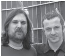
(Estevo é o peludo)

(Cee, 1971) ou a pregunta é anda? Seguidor da SUFATO e do seu voceiro na terra: inseminario.blogspot.com . Admirador fundamentalista de Marcos: o asesor nenodios, e da súa obra Liquidación de Existencias .